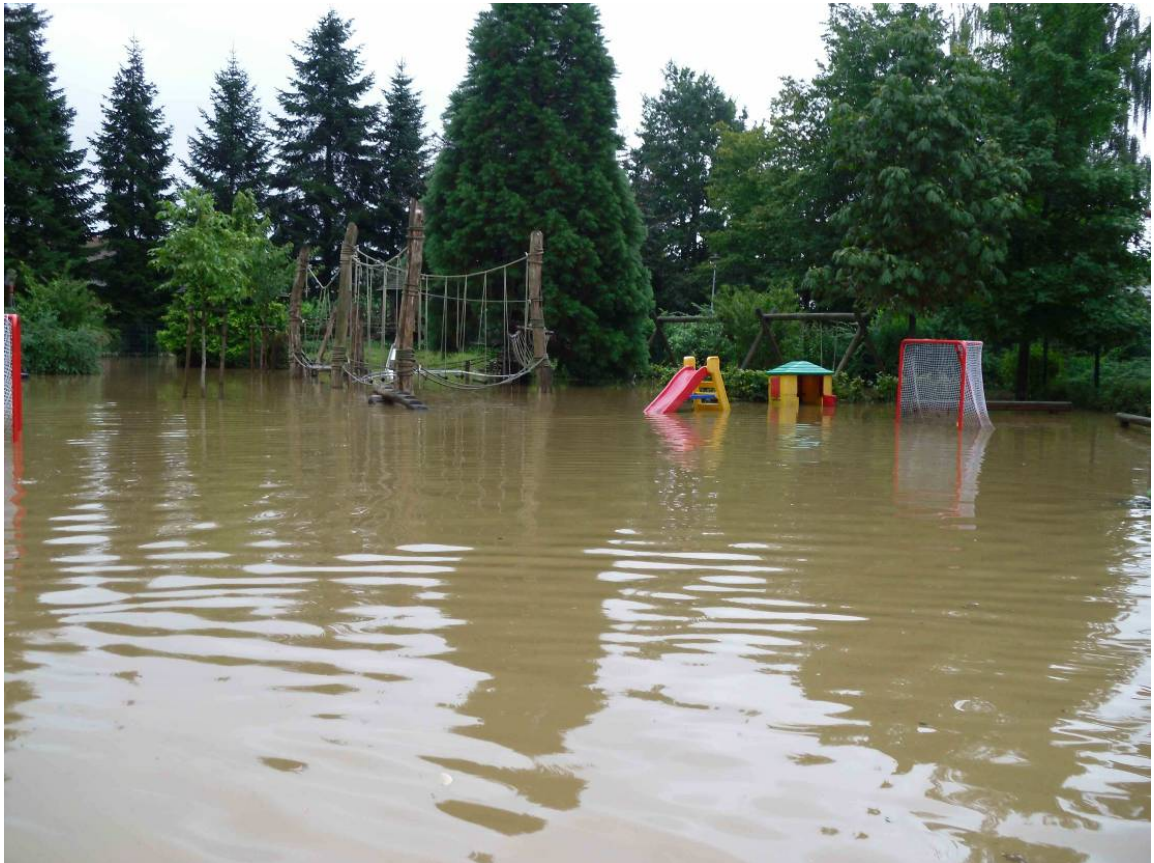
Abbildung 2: Hochwasser in Kindergarten Oesede 27.08.2010

Aufgrund der Lage der betroffenen Gebiete im Auenbereich der Düte ist ein technischer Hochwasserschutz durch Bauwerke nur eingeschränkt möglich. Um das Schadenspotential weiter zu minimieren ist ein wesentliches Augenmerk auf ereignisbezogenen Objektschutz zu legen, wie zum Beispiel der Sicherung von Immobilien und dem Entfernen von hochwertigen Gütern aus potentiell hochwassergefährdeten Bereichen kurz vor Eintreten des Hochwasserfalles. Für diese Maßnahmen ist die Vorwarnzeit der Betroffenen von wesentlicher Bedeutung für die Schadensminimierung.