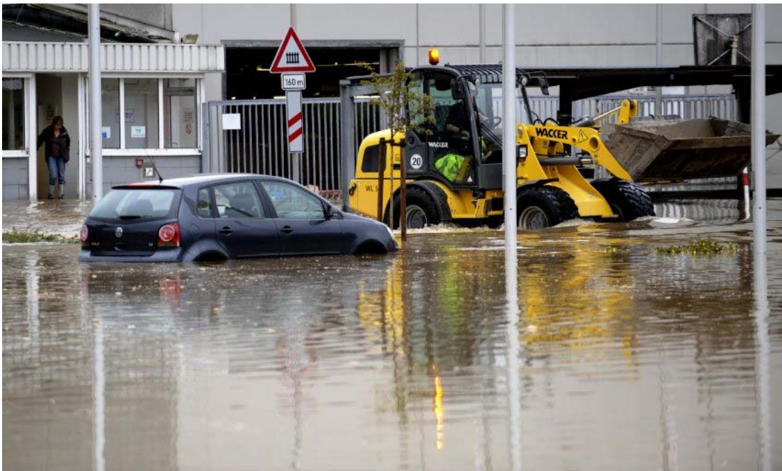
Abbildung 1: Gewerbebetrieb, Georgsmarienhütte-Oesede

In der Stadtmitte von Georgsmarienhütte kam es infolge von Überflutungen der Düte zu Aufstauungen von bis zu 90 cm mit der Folge, dass größere Gewerbeeinheiten vollständig geflutet wurden.